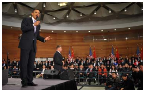
■ 奥巴马 16 日在上海一个美国式的镇民大会中与被安排的“学生”对话

美联社说：美国总统奥巴马在中国就言论自由和网络审查“将”了中共一军，可惜大多数中国民众看不到，因为他的话在网络上遭到封锁，而且只有一个地方电视转播。