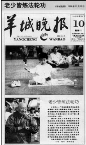
▶右图为《羊城晚报》1998年11月10日报道老少皆炼法轮功,炼功者来自各行各业,年龄最大的93岁,最小的仅两岁。