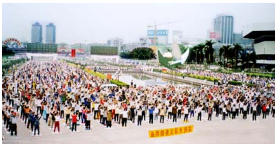
▲左图为一九九八年广州法轮功学员集体晨炼场景。