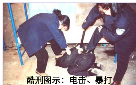
酷刑图示：电击、暴打

辽宁省女子监狱以追随中共迫害法轮功学员、酷刑洗脑而“闻名”，至今至少将十五名辽宁法轮功女学员迫害致死，包括沈阳铁西区六十六的善良