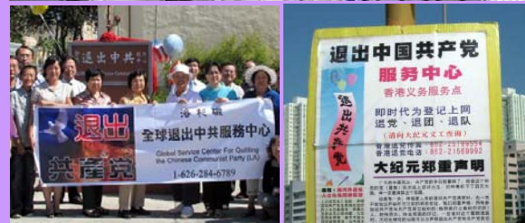
▲ 洛杉矶退党服务中心