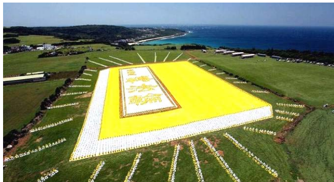
■ 2009年5月9日，6000多名台湾法轮功学员集体炼功，排演《转法轮》一书，贺大法传世十七周年。

● 弘传世界 各国褒奖 法轮功已弘传世界114个国家和地区，受到世界人民的爱戴和尊敬，获得各国政府褒奖、支持议案信函3000多项。法轮功书籍被译成30多种语言，在全世界出版发行，并可从网上免费下载。