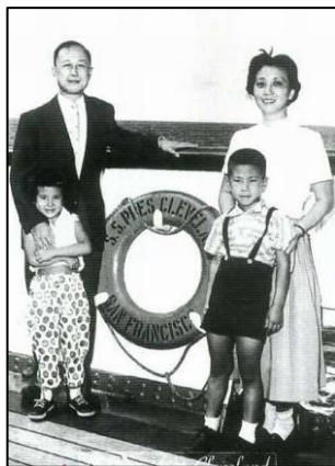
钱学森一家四口（摄于1955年）

早在1982年，钱学森就给中宣部副部长郁文写信表示：“保证人体特异功能是真的，不是假