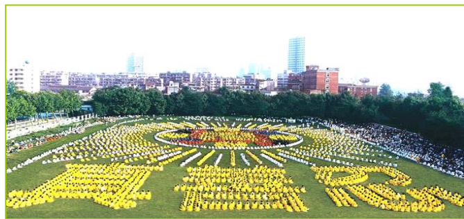
1997年武汉五千多法轮功学员炼功，排组法轮图形和“真善忍”字样

● 法轮大法弘传世界 法轮功已弘传世界114个国家和地区，受到世界人民的爱戴和尊敬。因李洪志先生和法轮大法对人类身心健康作出的杰出贡献，已获得各国政府褒奖、支持议案信函3000多项。法轮功书籍被译成30多种语言，在全世界出版发行，并可从网上免费下载。