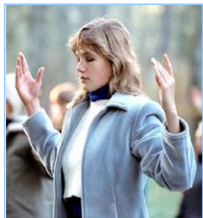
俄罗斯法轮功学员炼功

● 法轮功教人向善 法轮功是佛家修炼大法，以真、善、忍为修炼原则。修炼人从做好人做起，努力按照真、善、忍标准提升个人心性，返本归真；还包含五套缓慢优美的功法动作。法轮大法教人向善。修炼法轮功不但能祛病健身，使人变得诚实、善良、宽容、和平，而且能开启智慧，逐渐达到洞悉人生和宇宙奥秘的自在境界。