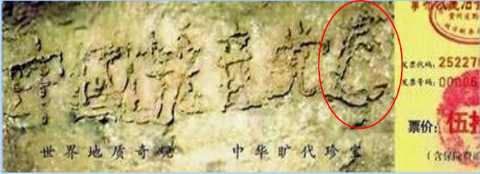
▲2002年在贵州平塘县掌布乡发现的藏字石，石头断面上天然形成六个字：中国共产党亡，最后的“亡”字特别大，昭示着“天灭中共”的天意。图为风景区门票。

一块2亿7千万年的巨石从崖壁落下，落地一分为二。2002年6月裂开的石头断面被当地人发现有一行汉字，这些汉字经三批国内专家鉴定，其结论为天然形成。而石头上清晰可见的六个字是：中国共产党亡(国内媒体隐去了亡字)。老天爷难道在“搞政治”吗？