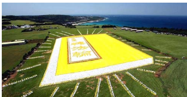
■2009年5月9日，6000多名台湾法轮功学员集体炼功，排演《转法轮》一书，贺大法传世十七

● 弘传世界 各国褒奖 法轮功已弘传世界114个国家和地区，受到世界人民的爱戴和尊敬，获得各国政府褒奖、支持议案信函3000多项。法轮功书籍被译成30多种语言，在全世界出版发行，并可从网上免费下载。