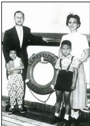
钱学森一家四口（摄于1955年）

早在1982年，钱学森就给中宣部副部长郁文写信表示：“保证人体特异功能是真的，不是假的。”钱学森与时任国防