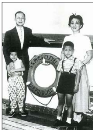
钱学森一家四口（摄于 1955 年）

早在 1982 年，钱学森就给中宣部副部长郁文写信表示：“保证人体特异功能是真的，不是假