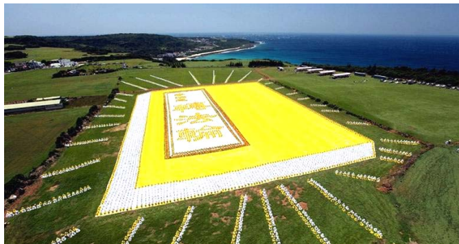
■ 2009年5月9日，6000多名台湾法轮功学员集体炼功，排演《转法轮》一书，贺大法传世十七周年。

● 弘传世界 各国褒奖 法轮功已弘传世界114个国家和地区，受到世界人民的爱戴和尊敬，获得各国政府褒奖、支持议案信函3000多项。法轮功书籍被译成30多种语言，在全世界出版发行，并可从网上免费下载。