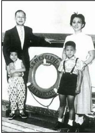
钱学森一家四口（摄于 1955 年）

忍”，在各种环境中努力做一个更好的人，尽职尽责。九九年七月二十日中共邪党开始迫害法轮功后，她于九九年十一月和同修们一起到北京天安门证实大法、说明法轮功真相，被当地公安局派出所从北京绑架回到本地看守所非法关押近二个月。