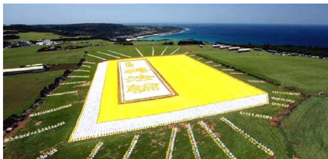
■ 2009年5月9日，6000多名台湾法轮功学员集体炼功，排演《转法轮》一书，贺大法传世十七周年。

● 弘传世界 各国褒奖 法轮功已弘传世界114个国家和地区，受到世界人民的爱戴和尊敬，获得各国政府褒奖、支持议案信函3000多项。法轮功书籍被译成30多种语言，在全世界出版发行，并可从网上免费下载。