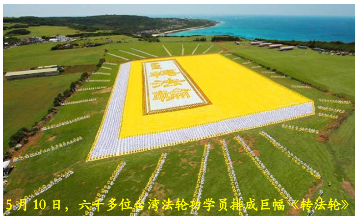
5月10日，六十多位台湾法轮功学员排成巨幅《转法轮》