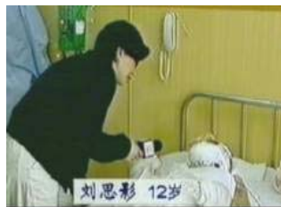
气管切开还能说、唱？记者采访不穿防护服，不戴口罩

同时 Z 医生还说：“积水潭医院对待重度烧伤病人很早就一直使用其自制的药，叫‘烧伤二号’，其中一味药要用酒精浸泡，然后把配好的药涂抹在