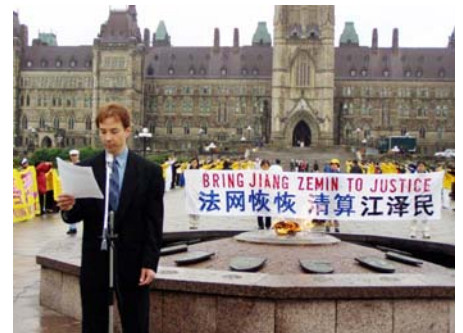
加拿大法轮功学员在国会山前举行活动，要求中共立即停止对法轮功学员的迫害。（2003 年）