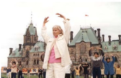
加拿大法轮功学员在国会山前炼功，以和平的方式抗议中共对法轮功学员的迫害。（1999年10月）

一九九九年七月二十日，中共发动了对法轮功的全面迫害。这场迫害不仅针对法轮功学员的“真善忍”信仰，也针对所有人的道德原