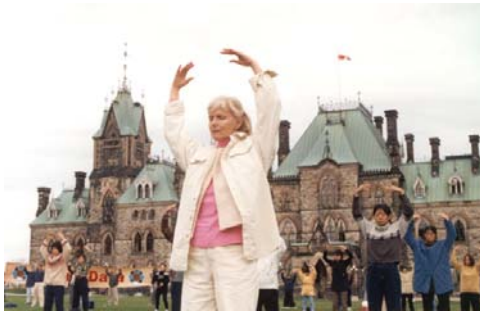
加拿大法轮功学员在国会山前炼功，以和平的方式抗议中共对法轮功学员的迫害。（1999年10月）

一九九九年七月二十日，中共发动了对法轮功的全面迫害。这场迫害不仅针对法轮功学员的“真善忍”信仰，也针对所有人的道德原