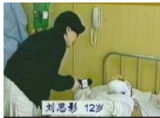
气管切开还能说、唱？记者采访不穿防护服，不戴口罩

同时 Z 医生还说：“积水潭医院对待重度烧伤病人很早就一直使用其自制的药，叫‘烧伤二号’，其中一味药要用酒精浸泡，然后把配好的药涂抹在