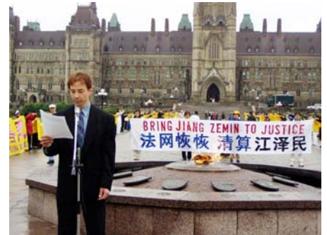
加拿大法轮功学员在国会山前举行活动，要求中共立即停止对法轮功学员的迫害。（2003 年）

则和精神价值进行摧毁。联合国、世界各地的一些政府团体、人权组织和独立调查员们，共同证实了中共酷刑迫害法轮功修炼者并有组织地从被囚禁的法轮功学员身上盗取人体器官非法出售的事实。