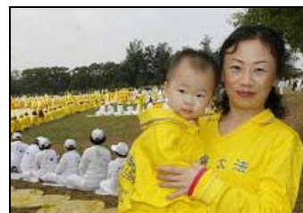
左：一家大小齐来参加组字 右：日本的许田母子