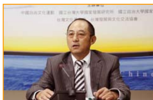
知名法学家袁红冰

针对日前西班牙国家法庭裁定,以“群体灭绝罪”及“酷刑罪”起诉中共前党魁江泽民及其死党罗干、薄熙来、贾庆林和吴官正这五名迫害法轮功的元凶,中国