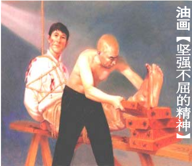
油画【坚强不屈的精神】

滴，也是亿万个善良法轮功学员十年来被中共暴虐的一个缩影。中共为什么打击“真善忍”，因为它是“假恶斗”。“真善忍”的存在，使中共“假恶斗”的丑恶嘴脸大白天下。法轮功学员在中共的暴虐中，所表现出的坚贞、无畏、真诚、善良、宽容的高尚精神，是天地间令所有生命最最敬仰的永恒的高贵典范！