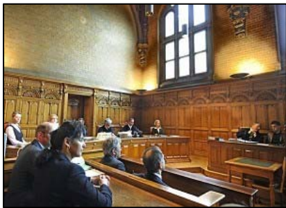
西班牙国家法院