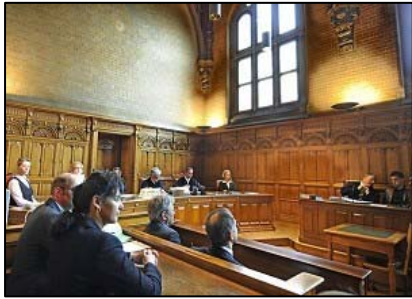
西班牙国家法院