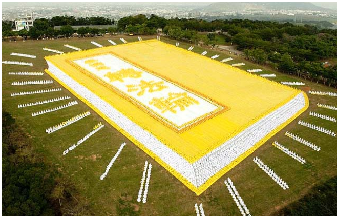
■ 2009年11月21日，亚洲法轮大法修炼心得交流会召开前夕，六千多法轮功学员在台湾台中县外埔乡青青草原，排出了金光灿灿的巨型《转法轮》。

法轮功也称法轮大法，是由李洪志先生于1992年5月传出的佛家上乘修炼大法，以“真善忍”为根本指导。经亿万人的修炼实践证明，法轮大法是大法大道，在把真正修炼的人带到高层次的同时，对稳定社会、提高人们的身体素质和道德水准，起到了不可估量的正面作用。