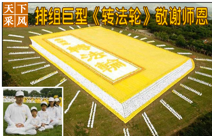
二零零九年十一月二十一日，在台湾台中县外埔

法轮大法至今已弘传世界 110 多个国家和地区，获得各国政府褒奖、支持议案信函 3000 多项。法轮功的主要书籍《转法轮》已翻译成 30 多种文字，在全世界出版发行，并可从互联网上免费下载。《转法轮》成为世界上流行最广的书籍之一。