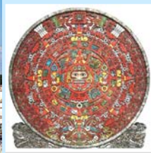
玛雅金字塔和玛雅人的历法盘