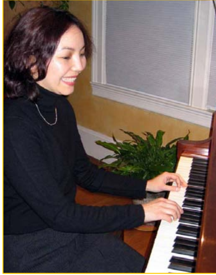
■ 钢琴家嘉娜拉·卡森诺娃

改变自己的那一天，嘉娜拉说，其实是悄然而来的。“二零零三年的三四月间，我在波士顿一家牙医诊所