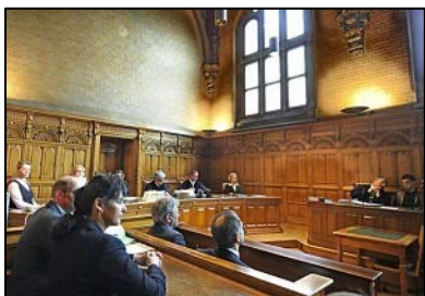
西班牙国家法院

西班牙“国际特赦”司法部门负责人阿里斯·莫勒诺于二零零九年十一月二十七日接受采访时表示：“近年来西班牙司法一直致力于追查国际重大刑事案，是国际司法界的榜样，同时震慑了反人类罪行的发生，这是很好的现象。”