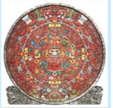
玛雅金字塔和玛雅人的历法盘