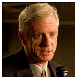
加拿大前亚太司司长大卫·乔高

西班牙法庭引用的国际法“普世司法管辖权原则”主要适用于群体灭绝罪；危害人类罪；战争罪；侵略罪等罪行。因十五位起诉人指控江泽民等嫌犯所犯罪行危害全人类，后果极为严重，依照普世司法管辖原则，不允许出现管辖权投机，无论被告是在何处犯罪，只要罪名成立，任何国家都有权对嫌犯加以惩罚，只要他们走出国门，随时都可能面临被逮捕的危险。