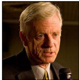
加拿大前亚太司司长大卫·乔高

西班牙法庭引用的国际法“普世司法管辖权原则”主要适用于群体灭绝罪；危害人类罪；战争罪；侵略罪等罪行。因十五位起诉人指控江泽民等嫌犯所犯罪行危害全人类，后果极为严重，依照普世司法管辖原则，不允许出现管辖权投机，无论被告是在何处犯罪，只要罪名成立，任何国家都有权对嫌犯加以惩罚，只要他们走出国门，随时都可能面临被逮捕的危险。