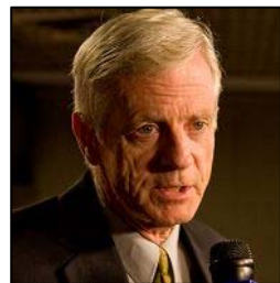
加拿大前亚太司司长大卫·乔高

二零零九年十一月二十五日，前任加拿大亚太司司长大卫·乔高在接受记者采访时说：“我认为欧洲一个主要国家的独立法庭能够做出这样的决定，是一个意义非凡的进展。”“西班牙法官说，如果在一定时间内，法庭没有得到回应，法庭就会向五名高官发出通缉令——中国前国家主席面临起诉，这真是一个巨大的进展！”“我知道世界各地的媒体都在报道这件事，所以它真的是非凡的一步。我知道，阿根廷的法院也正在考虑这个案件，他们