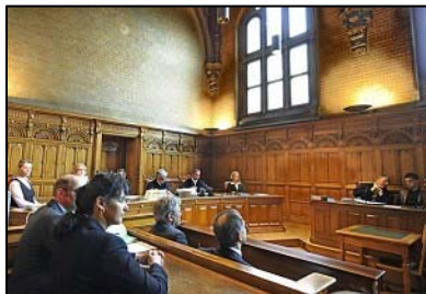
西班牙国家法院