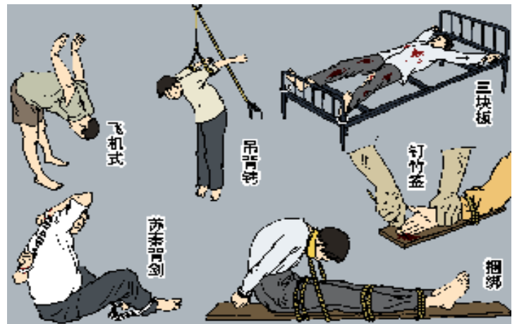
部份酷刑迫害示意图