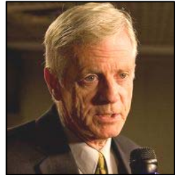
加拿大前亚太司司长大卫·乔高

西班牙法庭引用的国际法“普世司法管辖权原则”主要适用于群体灭绝罪；危害人类罪；战争罪；侵略罪等罪行。因十五位起诉人指控江泽民等嫌犯所犯罪行危害全人类，后果极为严重，依照普世司法管辖原则，不允许出现管辖权投机，无论被告是在何处犯罪，只要罪名成立，任何国家都有权对嫌犯加以惩罚，只要他们走出国门，随时都可能面临被逮捕的危险。