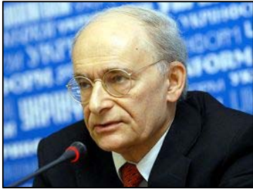
加国著名人权律师大卫·麦塔斯

二零零八年度加拿大勋章得主、著名人权律师大卫·麦塔斯认为，西班牙起诉是个积极的进展。他说：“在我看来证据强有力，是有正当理由的起诉，只是如何找到合适的方式的问题。理想情况是依据国际法，如果可能的话，由中国在国际法庭检控这些人。但现在的问题是，中国（中共当局）给这些做坏事的人豁免权……”。