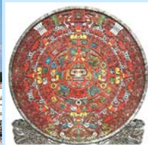
玛雅金字塔和玛雅人的历法盘