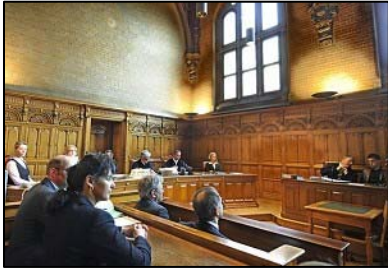
西班牙国家法院