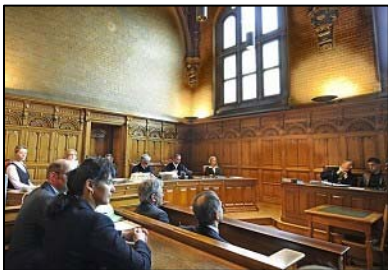
西班牙国家法院