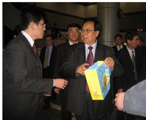
法轮功学员将诉状亲自递送给正在台北参访的前河南省委书记徐光春(手拿纸袋者)