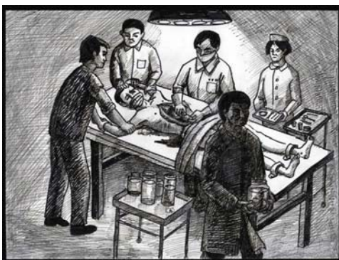
■ 中共活体摘取法轮功学员器官模拟图