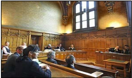
西班牙国家法院

2009 年 11 月，西班牙国家法庭做出了一项史无前例的裁定，决定以“群体灭绝罪”及“酷刑罪”，起诉江泽民、罗干、薄熙来、贾庆林、吴官正五名迫害法轮功的中共元凶。法院通知书表示，若被告的罪名成立，将面临至少二十年徒刑，并附带经济上的惩罚。据分析，在国际上，会有很多国家相继效仿西班牙国家法庭，同时鼓励在其他国家进展中的起诉江泽民案件。