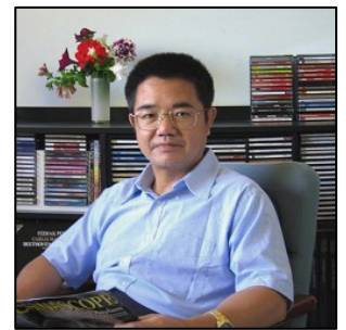
中国著名人权律师郭国汀

首位在中国境内为法轮功学员辩护、现定居在加拿大西部的中国著名人权律师郭国汀认为，西班牙国家法庭正式以刑事诉讼形式，以“群体灭绝罪”及“酷刑罪”起诉五名首恶，目前可以说