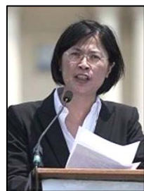
台湾知名人权 律师朱婉琪