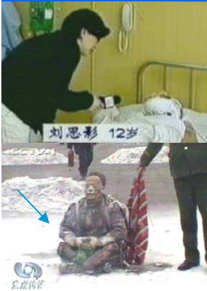
上图：小思影气管割开还能唱歌。下图：王进东衣裤被火烧破，两腿间的塑料瓶竟没变形。

治疗（上图）；公安部主办的《人民公安报》于1993年9月21日为此作了专题报道。12月27日该基金会授予李洪志先生荣誉证书。