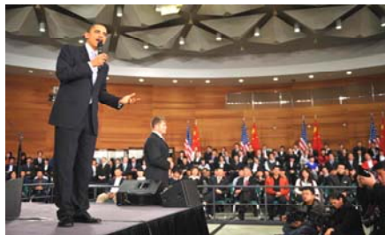
■ 奥巴马 16 日在上海一个美国式的镇民大会中与被安排的“学生”对话

美联社 11 月 16 日以“中共监控系统封杀奥巴马网络自由的言论”为题，报导了中共对奥巴马