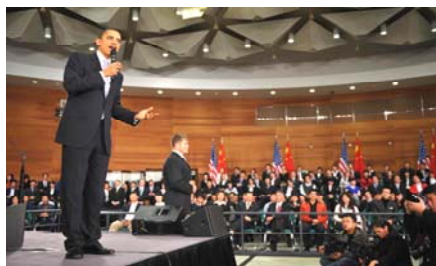
■ 奥巴马 16 日在上海一个美国式的镇民大会中与被安排的“学生”对话

美联社 11 月 16 日以“中共监控系统封杀奥巴马网络自由的言论”为题，报导了中共对奥巴马