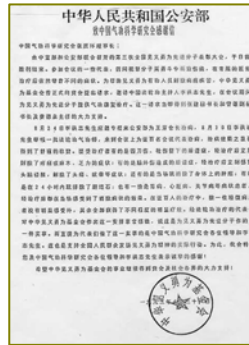
公安部所属中华见义勇为基金会致信感谢李洪志先生

1993年12月在北京东方健康博览会上，李洪志先生获博览会最高奖“边缘科学进步奖”，和大会的“特别金奖”，以及“受欢迎的气功师”称号，在该届博览会上，李洪志先生是荣