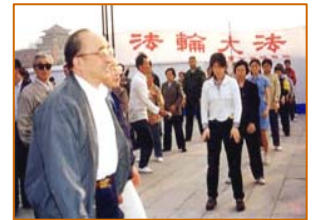
国家体育总局局长伍绍祖赴法轮大法发祥地长春考察（1998年5月15日）

发表讲话说：“我们认为法轮功的功法功效都不错，对于社会的稳定，对于精神文明建设，效果是很显著的，这个要充份肯定的。”