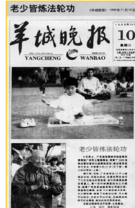
1998年11月10日《羊城晚报》：老少皆炼法轮功

1999年中共镇压前，在中国大陆已有一亿人在修炼法轮功，当时的大陆媒体，对法轮功祛病健身的奇效和教人向善的良好道德风范，做过多次的报道。1997年3月17日，《大连日报》刊登通讯“无名老者默默奉献”，报导学法轮功的古稀老人无偿为村民修路。1998年7月10日，《中国经济时报》以《我站起来了！》为题报道