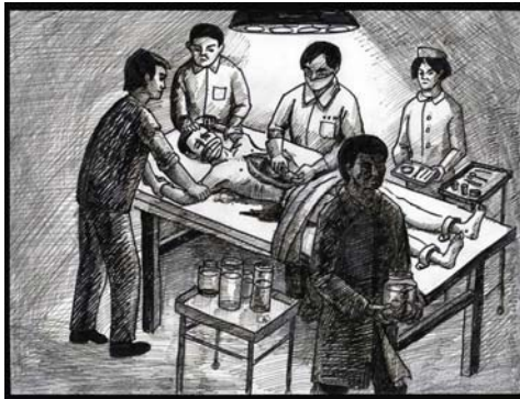
■ 中共活体摘取法轮功学员器官模拟图