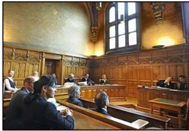
西班牙国家法院