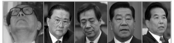
江泽民 罗干 薄熙来 贾庆林 吴官正

其实，按照人性、道德这些超越任何政治、经济等世俗的理念，江泽民、罗干这些中共头目迫害法轮功，其非法的本质毫无疑问，对人类的危害也毫无疑问。在迫害事实越来越真相大白、在法轮功学员坚守的“真、善、忍”对人类未来的重要性越来越广为人们认知的时候，必然会有更多的人们坚定的站出来，以各种各样的方式支持法轮功学员、维护“真、善、忍”信仰，迫害者也会在世界各地被诉诸法律。◇