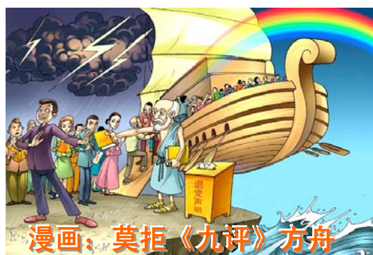
漫画：莫拒《九评》方舟

现在全球热映的电影《2012》，引发了人们对人类未来命运的思考，让人也想到当今的中共，它杀害了八千万中国人，更是残酷迫害法轮功修炼人，多行不义必自毙，天灭中共是历史的必然。法轮功学员在危难中向人们传《九评共产党》、讲述法轮功真相，希望更多人平安度过劫难。为了不受中共恶报的连累，曾经加入过中共党、团、队的人们，在这关键时刻选择远离中共，就是给自己