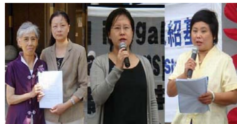
澳洲起诉中共多名迫害元凶三个诉讼案的部份原告

止中共对法轮功的迫害。欧洲议会副主席斯考特先生在发言中说，他对西班牙最高法院起诉江泽民等五人的决定非常欢迎。他想要警告在中国施行迫害或酷刑行径的那些人，在当今社会，酷刑罪是没有豁免权的。