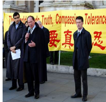
欧洲议会副主席斯考特先生在记者会上发言

止中共对法轮功的迫害。欧洲议会副主席斯考特先生在发言中说，他对西班牙最高法院起诉江泽民等五人的决定非常欢迎。他想要警告在中国施行迫害或酷刑行径的那些人，在当今社会，酷刑罪是没有豁免权的。