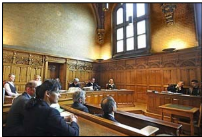
西班牙国家法院