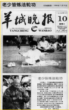
1998年11月10日《羊城晚报》：老少皆炼法轮功