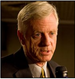
加拿大前亚太司司长大卫·乔高

2000 年 2 月塞内加尔法庭也成功引用“普世司法管辖权原则”，对乍得 (Chad) 前流亡总统 Hissein Habre（侯赛因），1982 至 1990 年间参与 4 万件政治谋杀和 20 万件的刑求案罪行提起诉讼。乍得国内