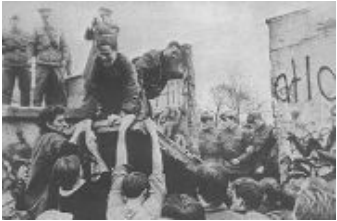
1989年11月，柏林墙推倒瞬间

【明慧网二零零九年十二月十七日】这个故事发生在柏林墙倒塌之后的德国。1992年2月，统一后的柏林法庭上，举世瞩目的柏林围墙守卫案将要开庭宣判。这次接受审判的是4个年轻人，30岁都不到，他们曾经是柏林墙的东德守卫。