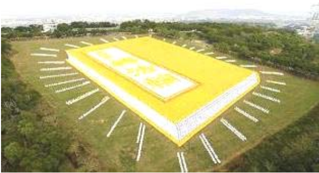
2009 年 11 月 21 日，六千多名亚太地区的法轮功学员在台湾台中县外埔乡“农会休闲综合农牧场”面积达十公顷的青青草原，排出了金光灿灿的巨型《转法轮》

● 弘传世界 各国褒奖 法轮功已弘传世界 114 个国家和地区，受到世界人民的爱戴和尊敬，获得各国政府褒奖、支持议案信函 3000 多项。法轮功书籍被译成 30 多种语言，在全世界出版发行，并可从网上免费下载。