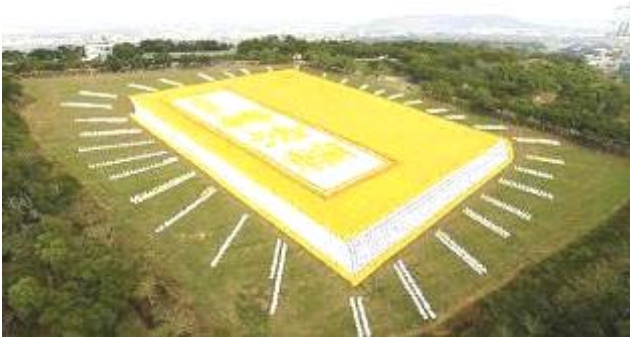
2009 年 11 月 21 日，六千多名亚太地区的法轮功学员在台湾台中县外埔乡“农会休闲综合农牧场”面积达十公顷的青青草原，排出了金光灿灿的巨型《转法轮》

● 弘传世界 各国褒奖 法轮功已弘传世界 114 个国家和地区，受到世界人民的爱戴和尊敬，获得各国政府褒奖、支持议案信函 3000 多项。法轮功书籍被译成 30 多种语言，在全世界出版发行，并可从网上免费下载。