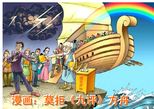
漫画：莫拒《九评》方舟