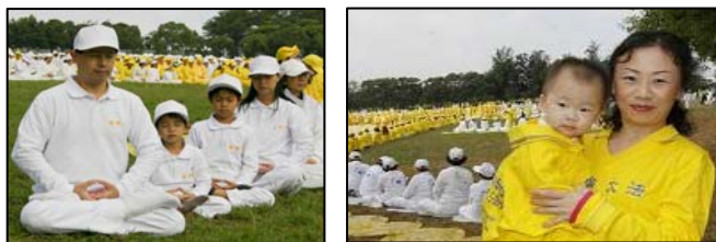
左：一家大小齐来参加组字 右：日本的许田母子