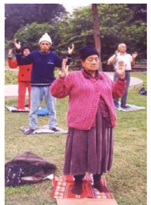
■ 炼功的印第安母亲