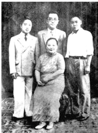
■中：胡适；左：长子胡祖望；右：次子胡思杜。

己的思想，表现十分积极，还写了《对我的父亲——胡适的批判》，表示与胡适划清界线。胡适知道后说：“我们早知道，共产主义国家里，没有言论的自由；现在我们更知道，连沉默的自由，那里也没有。”后来胡思杜被打成“右派”，精神崩溃，留下一封满纸辛酸的遗书，自杀身亡，这一年他三十六岁。