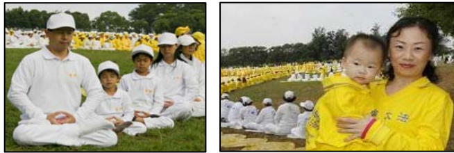
左：一家大小齐来参加组字 右：日本的许田母子