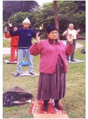
■ 炼功的印第安母亲