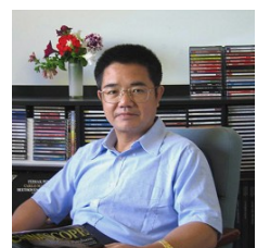
中国著名人权律师郭国汀