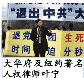
大华府及纽约著名人权律师叶宁