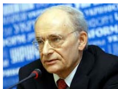
加拿大著名人权律师大卫·麦塔斯