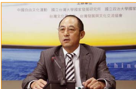
知名法学家袁红冰

袁红冰表示，进入二十一世纪以来，在人类社会发生了很多人权灾难，而中共暴政对法轮功的群体灭绝性的大屠杀大迫害，是当代人类最严重的人权灾难之一。多年来法轮功学员为了坚持自己信仰的自由，同时为了替中国境内那些被中共暴政迫害的学员伸张正义，进行了一系列司法起诉活动。对于西班牙国家法庭受理起诉江泽民等五名迫害法轮功的首恶，袁红冰认为，中共迫害法轮功的人权灾难，已深深地触动了人类的良知，法轮功的司法起诉活动也越来越