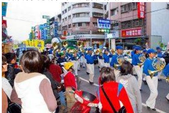
许多路人被游行队伍吸引

场”排字，下午于台中县大里市举办了声援六千四百万勇士退出中共相关组织的游行活动。三千多位来自台湾部份县市的法轮大法修炼者，下午三点集结在台中县大里市运动公园举办了行前记者会。多位中部地区的民意代表亲自到会场致意，随后的游行更获得当地民众的关注与认同。