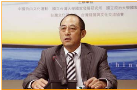
知名法学家袁红冰

袁红冰表示，进入二十一世纪以来，在人类社会发生了很多人权灾难，而中共暴政对法轮功的群体灭绝性的大屠杀大迫害，是当代人类最严重的人权灾难之一。多年来法轮功学员为了坚持自己信仰的自由，同时为了替中国境内那些被中共暴政迫害的学员伸张正义，进行了一系列司法起诉活动。对于西班牙国家法庭受理起诉江泽民等五名迫害法轮功的首恶，袁红冰认为，中共迫害法轮功的人权灾难，已深深地触动了人类的良知，法轮功的司法起诉活动也越来越