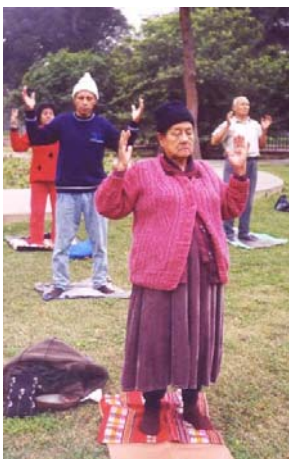
炼功的印第安母亲