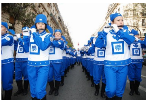
天国乐团穿过繁华的街道

业街区，到达市政府所在地。一路引来许多路人的观看和询问。众多的华人拿出手机或相机留下这一幕。◇