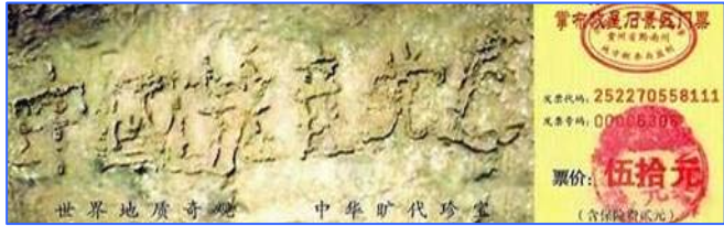
■贵州平塘县掌布风景区的“藏字石”，被中科院地质专家鉴定为五百年前从崖壁落下一分为二，石头断面上天然形成六个字——中国共产党亡，昭示着天灭中共的天象。

父亲知道后有些意外，没想到老上司这么容易就退了。看来中共内部的很多高层干部，都明白中共长不了了，都人心思退党呢。◇